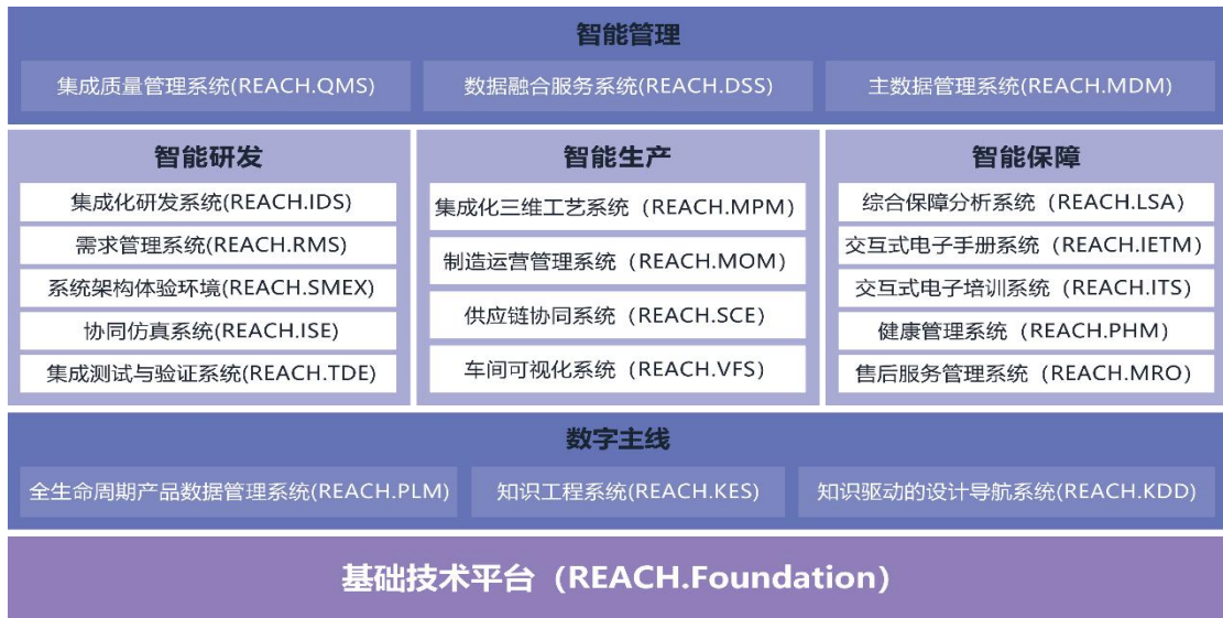
国睿信维 REACH 睿知自主产品谱系图

REACH.PHM、 REACH.MRO、 REACH.QMS、 REACH.DSS、 REACH.MDM、 REACH. KES、 REACH.KDD)组成，是国睿信维推出的一体化工业软件。REACH 睿知工业软件套件，具备前后端分离的 IT 架构，构建了面向用户角色的一站式全新体验交互模式。